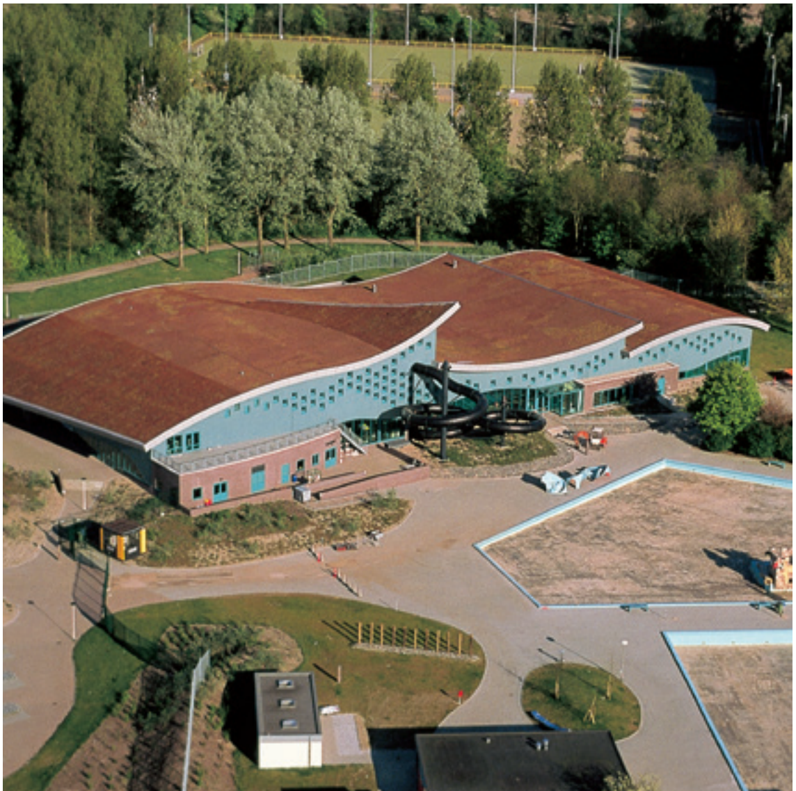
Piscina 'Het Keerpunt' (Países Bajos)

El sistema RENOLIT ALKORGREEN ofrece a nuestros clientes un sistema de cubierta ecológica optimizada y totalmente adaptada a nuestra membrana RENOLIT ALKORPLAN.