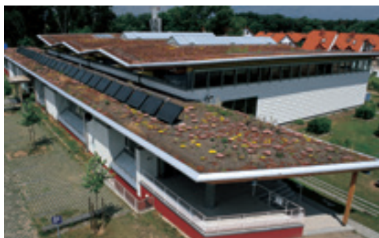
1 Centro Deportivo (Alemania)

*Algunas plantas como el bambú deben evitarse debido a la agresividad de sus raíces. Para obtener una lista completa de plantas prohibidas en el marco de cubiertas ajardinadas: Cf: « Krupka, Bernd. Dachbegrünung – Pflanzen und Vegetationsanwendung an Bauwerken ». Stuttgart, Ulmer. 2000)