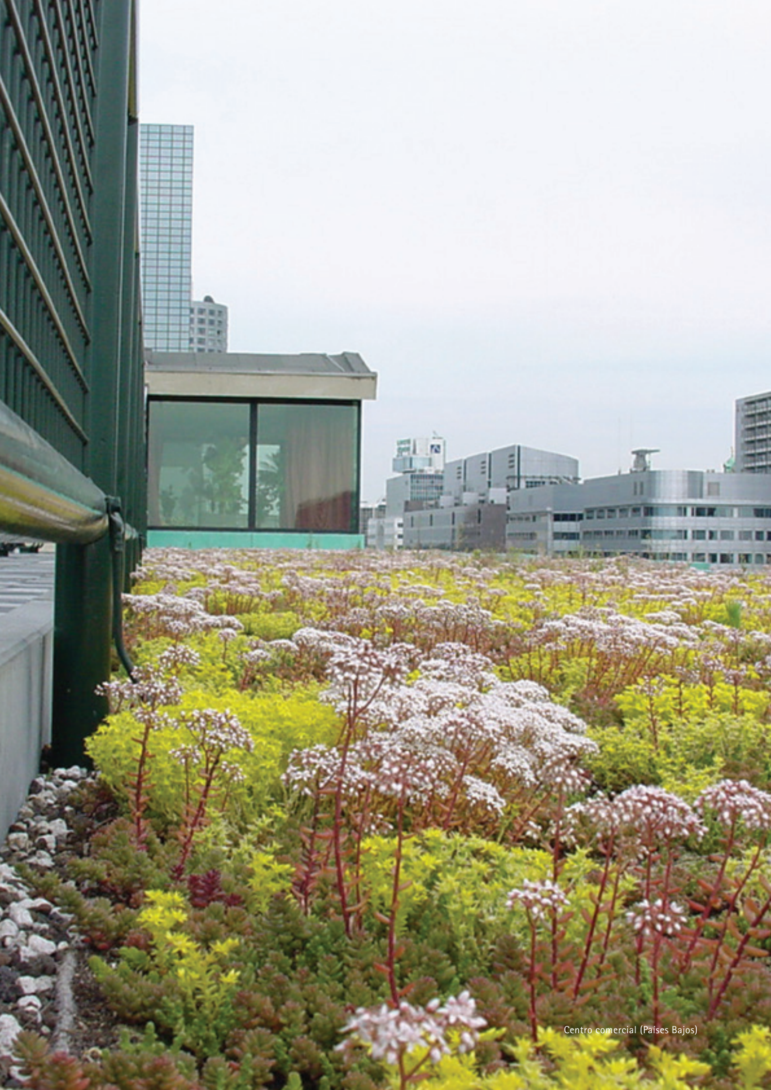
Centro comercial (Países Bajos)