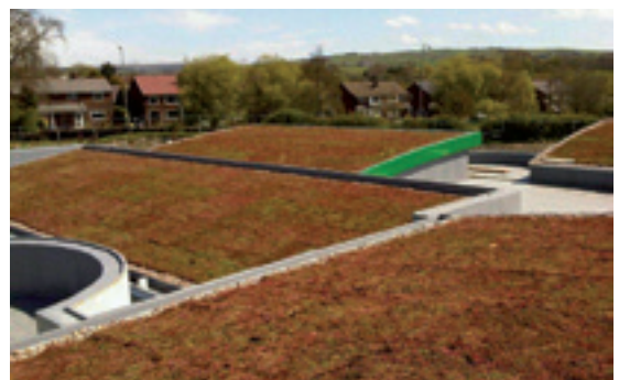
2 Escuela (Inglaterra)