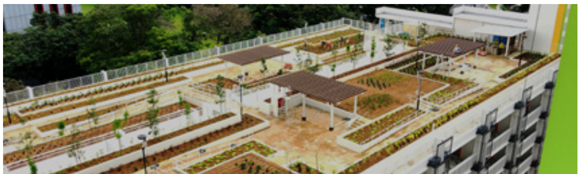
3 Public house