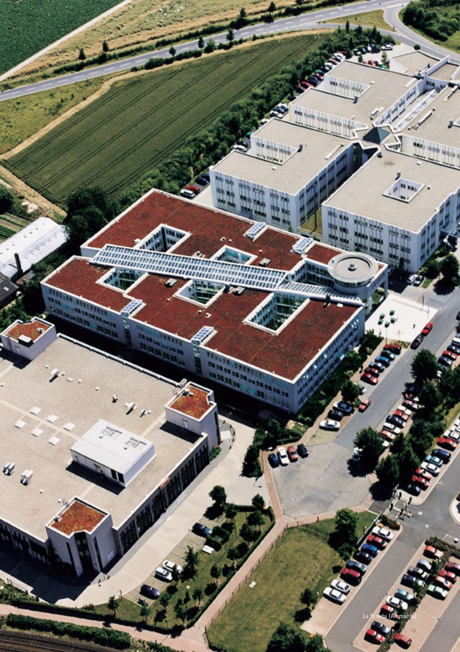
La Strada (Alemania)