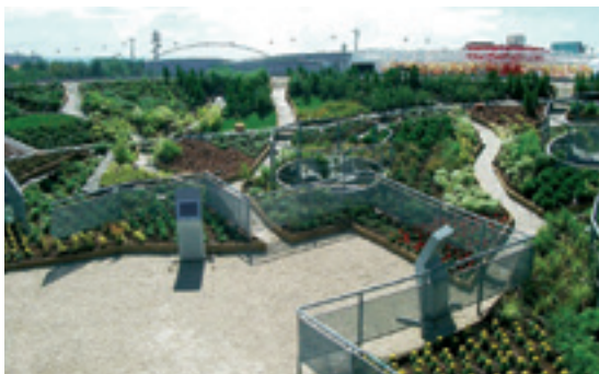
Plaza temática (España)

*Para cubiertas con una inclinación más grande, es importante contactar con los servicios técnicos de RENOLIT Ibérica.